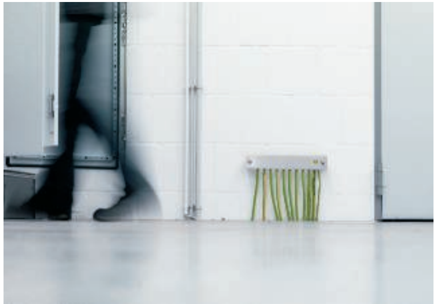
Сверху: комбинированный разрядник в распределительном шкафу. Внизу: шина уравнивания потенциалов. Справа: молниеприемная мачта.

Выход из строя технического оборудования на спортивных аренах и в концертных залах при попадании молнии недопустим. Надежную защиту от ударов молнии обеспечивает правильно установленная система молниезащиты. Кроме того, существенный вред наносит импульсное перенапряжение. Оно образуется в результате грозовых разрядов или коммутационных процессов в электрооборудовании. Наряду с повреждением установок, большой проблемой становится потеря данных в результате сбоя в телекоммуникационных сетях.