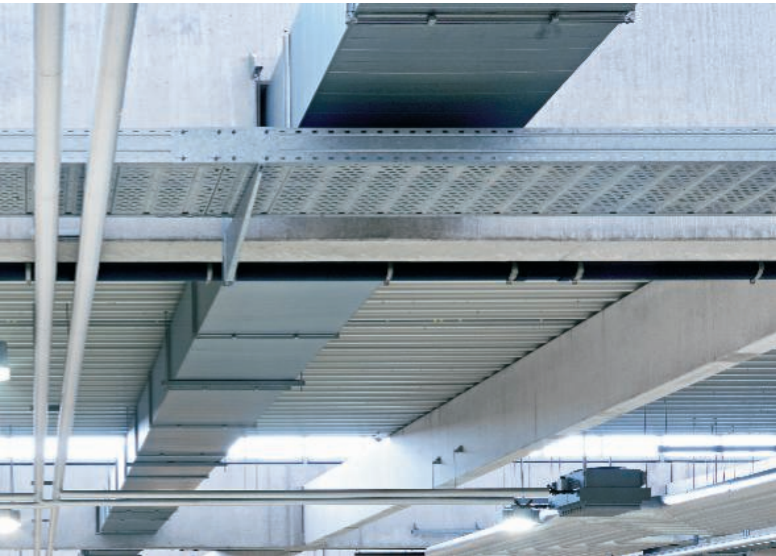
Кабеленесущая система для больших расстояний