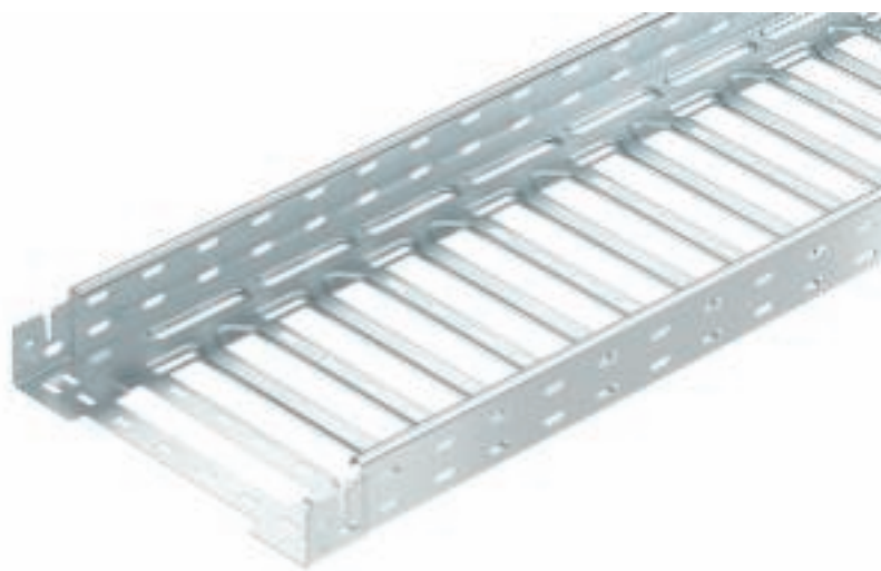
Справа по центру: система листовых лотков RKS-Magic®. Внизу: система листовых лотков MKS- Magic®.