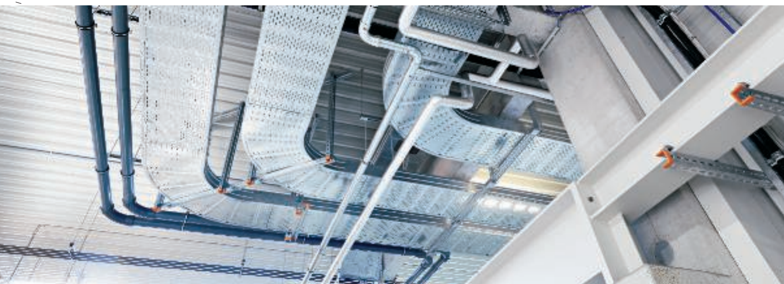
Кабеленесущая система для больших расстояний