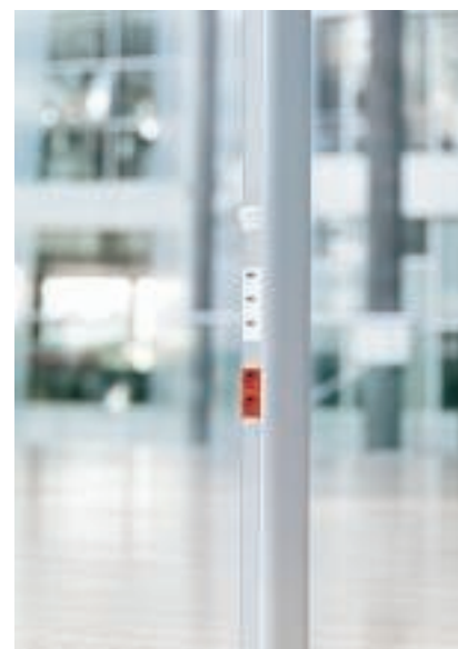
Электромонтажная стойка для напольного и потолочного монтажа

Кабель не образует препятствий, если он проложен в коробе на поверхности стены. Короб устанавливается на удобной высоте, предоставляя быстрый доступ к розеткам и телекоммуникационным разъемам. Тщательно разработанная система включает разнообразные фасонные детали и аксессуары для практичного монтажа. Элегантный дизайн всегда удачно подчеркнет обстановку.