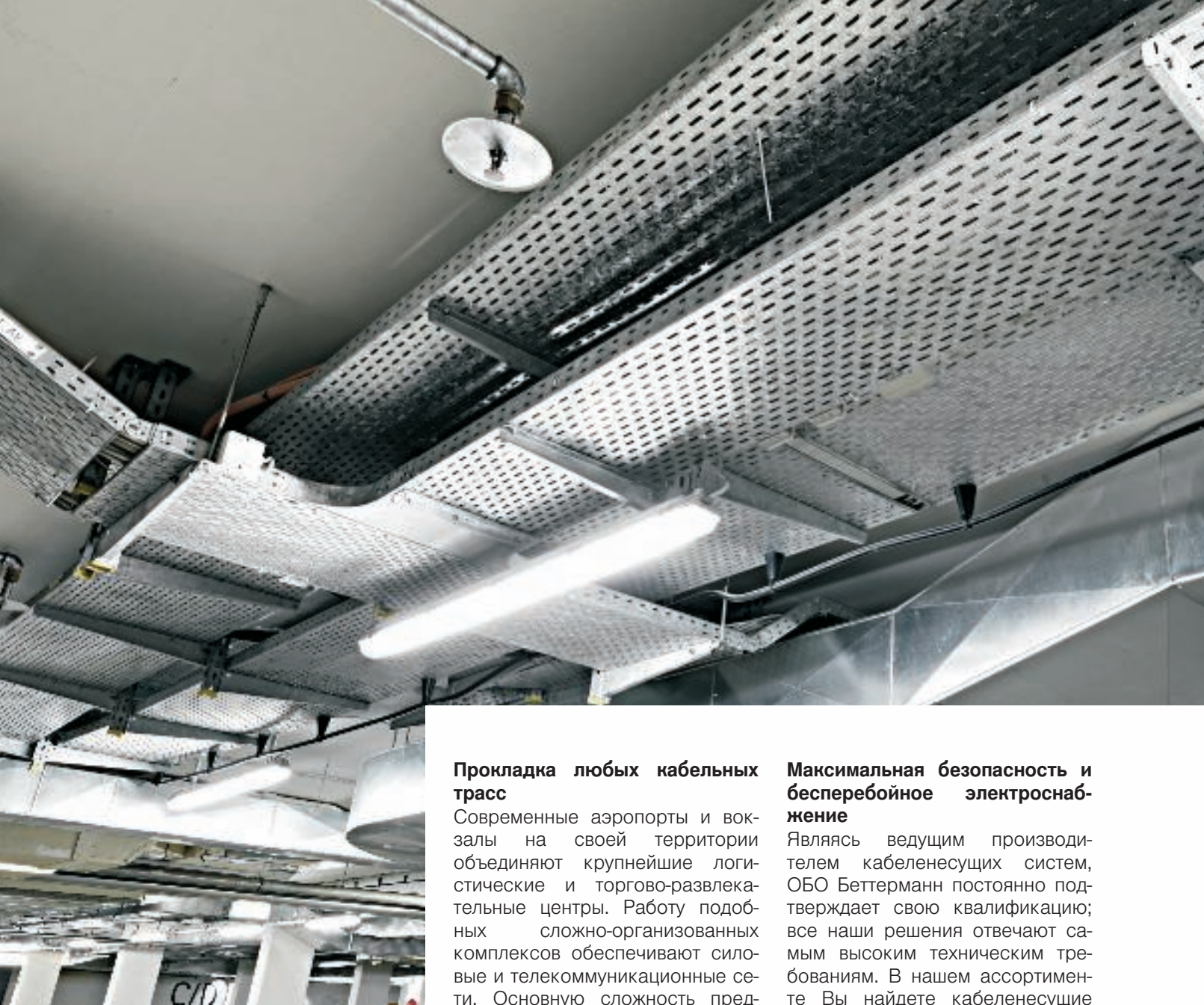
Система листовых кабельных лотков