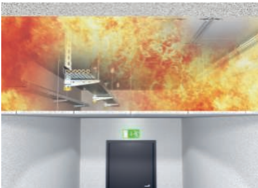
Монтаж кабельных трасс над подвесным противопожарным перекрытием